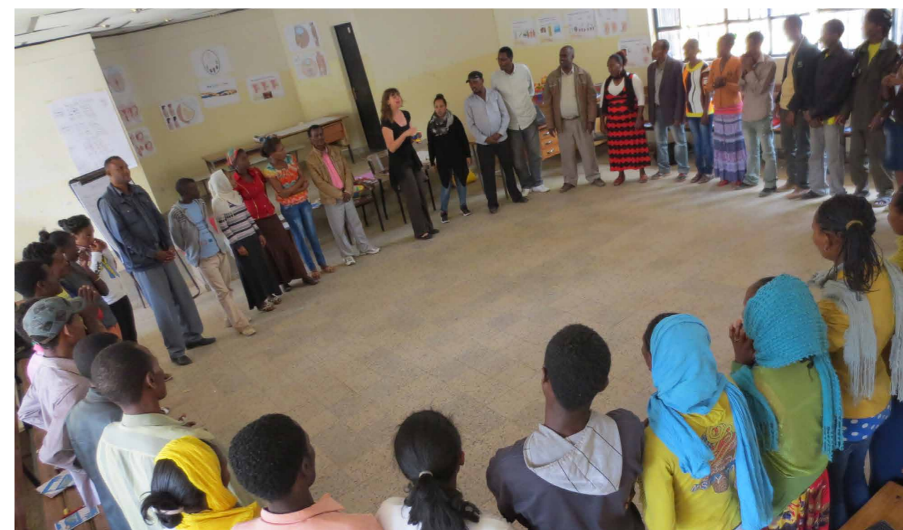
Role-Playing in Ethiopia

En tant que Rain Workers vous devez trouver des méthodes créatives , comme le théâtre et le jeu de rôle pour convaincre votre public de penser au planning familial